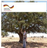
« Renforcement de la participation des femmes dans l'agriculture durable et la gestion des espaces naturels » Document d'orientation

Le renforcement de la participation des femmes dans la gestion intégrée des ressources en eau ;